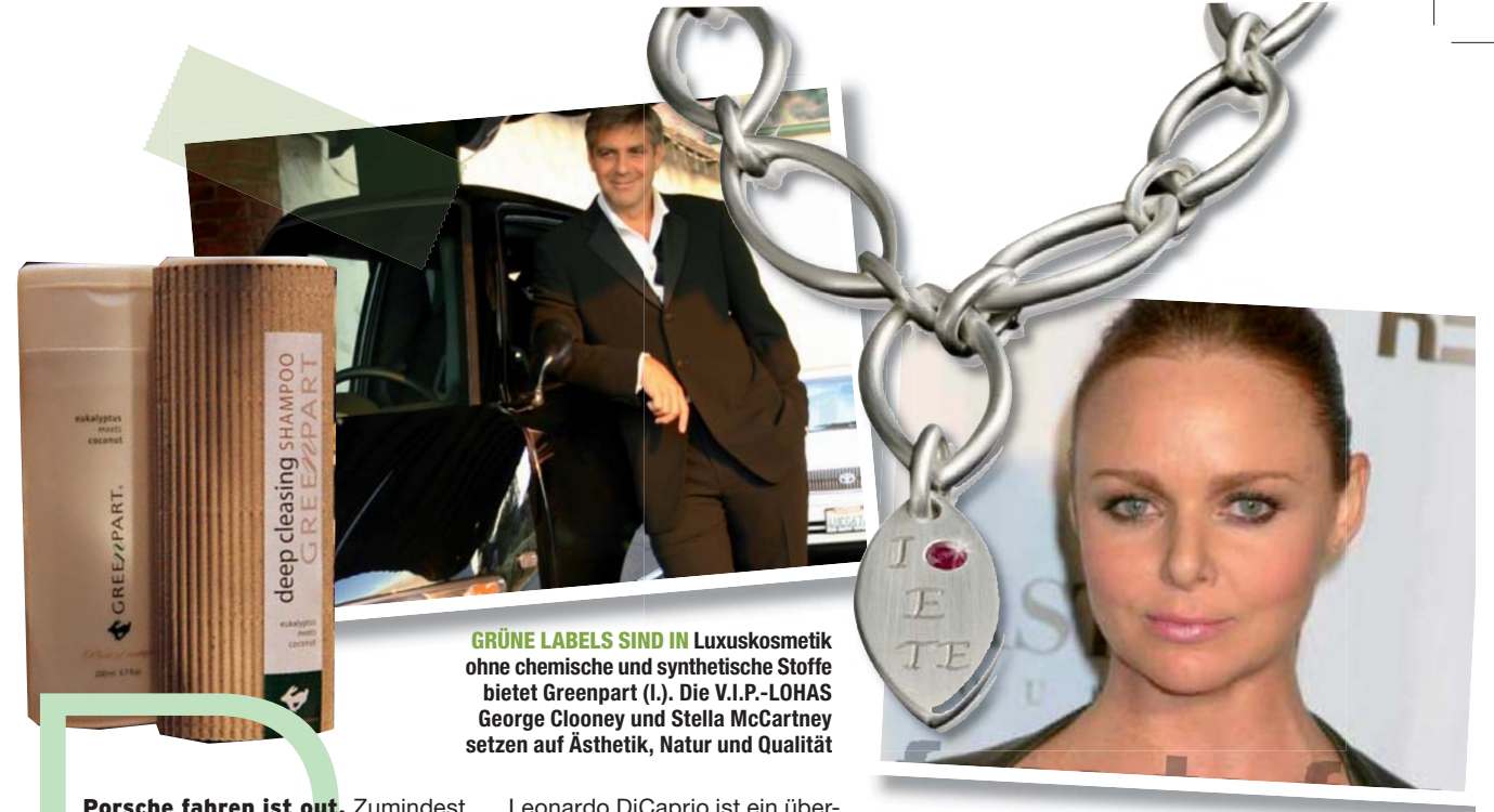
GRÜNE LABELS SIND IN Luxuskosmetik ohne chemische und synthetische Stoffe bietet Greenpart (I.). Die V.I.P.-LOHAS George Clooney und Stella McCartney setzen auf Ästhetik, Natur und Qualität

Porsche fahren ist out. Zumindest in Hollywood. George Clooney hat es vorgemacht – und jetzt protzen auch Stars wie Charlize Theron, Angelina Jolie oder Orlando Bloom nicht mehr mit edlen Limousinen oder schnellen Flitzern, sondern fahren lieber mit dem kleinen Schwarzen vor. Der neue Liebling der Promis heißt Prius und ist ein umweltschonendes Auto mit Hybridantrieb (fährt wechselweise mit Elektro- und Benzinmotor), es verbraucht pro Jahr eine Tonne weniger Kohlendioxid als ein „normaler“ Pkw). Kostenpunkt: 24.000 Euro und ein gutes grünes Gewissen gratis dazu. Tom Hanks war sogar so begeistert davon, dass er seine ganze Familie mit der süßen Öko-Kutsche ausstattete.