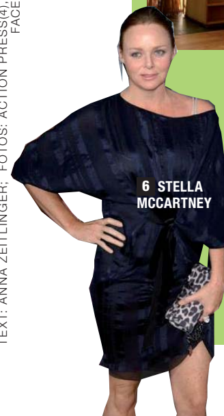
6 STELLA MCCARTNEY

1 FAIRE DIAMANTEN Die Schmuckstücke von IO E TE werden aus dem Fair-Trade-Handel bezogen 2 SOJA-SEIDE US-Designerin Ashley Paige kreiert daraus Bikinis und Underwear. Promikundinnen: J.Lo und Kate Hudson 3 CHEMIEFREI ist die Mavi Organic Jeans 4 SEXY wirkt die Kollektion des Labels NOIR 5 NATUR IST IN Auch Hotels setzen auf Umweltschutz, z.B. Hofgut Hafnerleiten 6 STELLA MCCARTNEY gilt als Trendsetterin des Öko-Chics 7 PANGEA ORGANICS produziert tolle Bio-Seifen