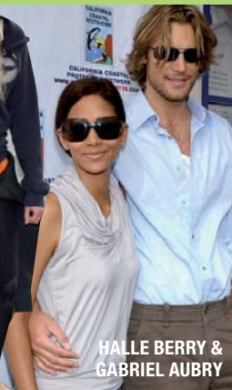
HALLE BERRY & GABRIEL AUBRY