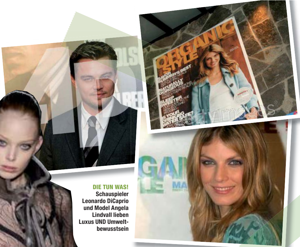
DIE TUN WAS! Schauspieler Leonardo DiCaprio und Model Angela Lindvall lieben Luxus UND Umweltbewusstsein