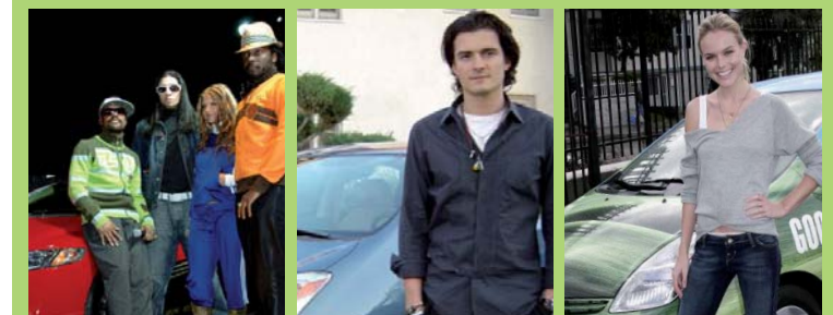
BLACK EYED PEAS machen auf ihrer Tour Werbung für den Honda Civic Hybrid

GANZ HOLLYWOOD FÄHRT AUF DIE ÖKO-AUTOS AB