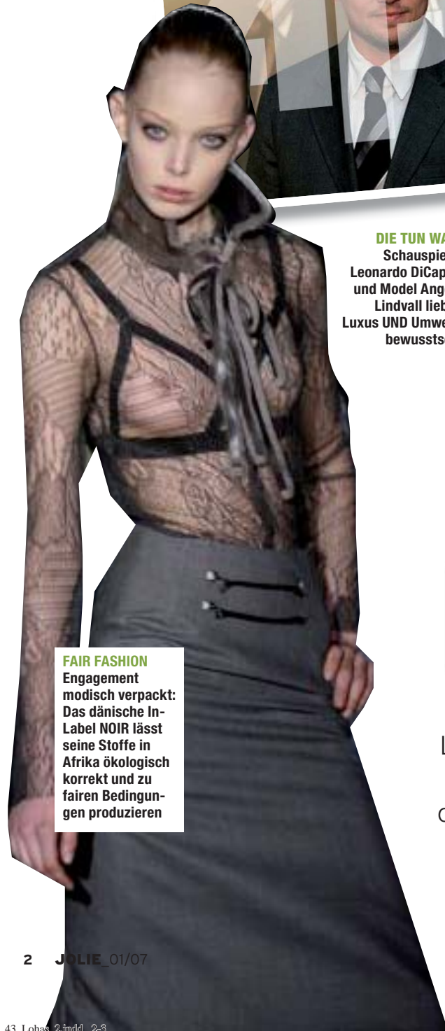
FAIR FASHION Engagement modisch verpackt: Das dänische In-Label NOIR lässt seine Stoffe in Afrika ökologisch korrekt und zu fairen Bedingungen produzieren